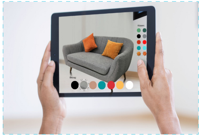
App Beispiel: Konfigurationsmöglichkeiten von Möbeln mit AR

Haben wir Ihr Interesse geweckt? Gerne senden wir Ihnen ausführlichen Content zum Lesen zu.